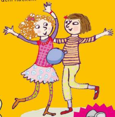
Auflösung: den Handschuh

Ein Spiel für Freundespaare: Jeweils zwei Kinder tanzen zu Musik, während sie einen Luftballon zwischen sich geklemmt haben. Mit der Stirn oder dem Bauch versuchen sie, ihn beim Tanzen festzuhalten. Die Hände bleiben auf dem Rücken.