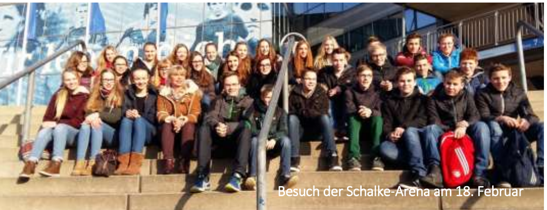
Besuch der Schalke-Arena am 18. Februar

FAMILIENNACHRICHTEN WERDEN AUS DATENSCHUTZGRÜNDEN NICHT VERÖFFENTLICHT