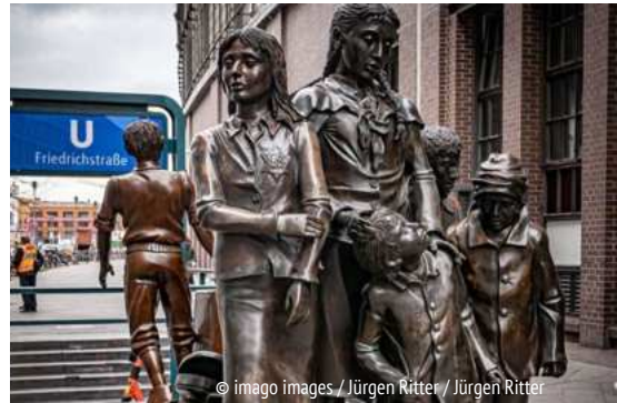
Kindertransporte: Denkmal in Berlin, Friedrichstraße