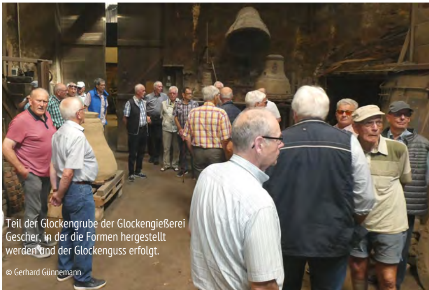
Teil der Glockengrube der Glockengießerei Gescher, in der die Formen hergestellt werden und der Glockenguss erfolgt.